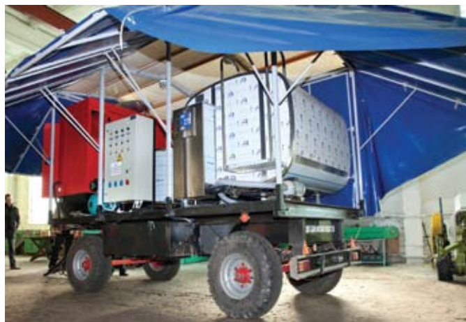
Комплекс передвижного доильного оборудования КПДО-8200

центры флагманов отечественной промышленности. К примеру, РУП «Минский тракторный завод» имеет три таких центра, где не только занимаются дилерской работой, но также проводят техобслуживание и ремонт тракторов предприятия различных модификаций. Практически все заказы на ремонт техники, поступившие из хозяйств, к началу календарной весны выполнены.