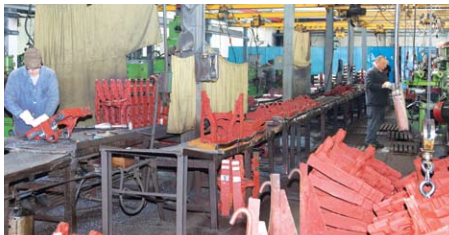
Цех по изготовлению комплектующих для ПО «МТЗ»

Коллективу нашего объединения предстоит сделать еще очень многое – это и внедрение новых ресурсосберегающих технологий, и повышение качества выпускаемой продукции, увеличение объемов производства, снижение себестоимости, и расширение спектра услуг. Конечно, для выполнения этих задач требуется работать слаженно и плодотворно, но это сегодня вполне по плечу нашему коллективу – коллективу профессионалов.